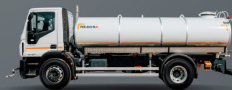
Cisterna za pitku vodu